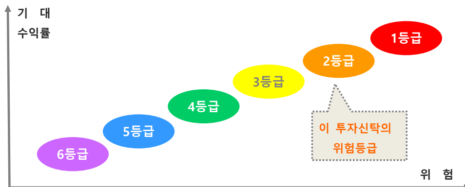
〈한화자산운용 투자위험등급 기준〉

※ 증권신고서 작성일 현재 이 투자신탁은 설정 후 3년이 경과하지 않아 ‘투자대상 자산의 종류 및 위험도’ 기준으로 위험등급을 산정하였으나, 설정 후 3년 경과 시 ‘실제 수익률 변동성’기준으로 투자위험등급을 재산정할 예정이며 이 경우 투자위험등급이 변동될 수 있습니다.